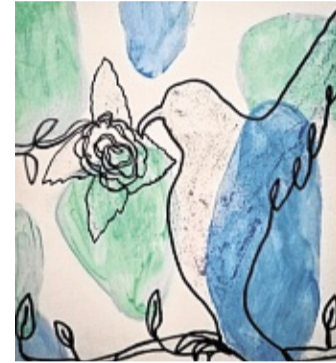
Friedenstaube, Laura Hause (14 Jahre).