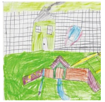
Traumgarten, Merle Hutterer (7 Jahre).

Plattform von Kindern für Kinder in Deutschland. Das macht Pixel-Paint sehr besonders. Bei unseren bisherigen Gesprächen mit Schulen oder Kulturträgern haben wir sehr gute Rückmeldungen erhalten. Das macht uns Mut. Wir wollen Pixel-Paint richtig groß machen und zeigen, dass auch Kinder mit der Gründung von Unternehmen erfolgreich sein können“, beschreiben Mar-