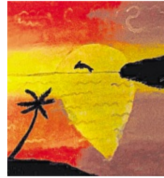
Delphin beim Sonnenuntergang von Laura Hause (14 Jahre).

möglichen, in der Schule erworbenes Wissen – insbesondere in Deutsch, Mathe und Kunst – in der Praxis anzuwenden und ihnen unternehmerische Grundlagen zu vermitteln. Zudem sollen sie darin bestärkt werden, eigene Ideen zu entwickeln, ihre Umsetzung strukturiert anzugehen und an den eigenen Erfolg zu glauben.“ Pixel-Paint geht ab sofort an den Start und ist sowohl als Website als auch als App für iOS und Android in den gängigen App-Stores verfügbar. Weitere Informationen unter www.pixel-paint.de . „Wir sind die einzige Kunst-